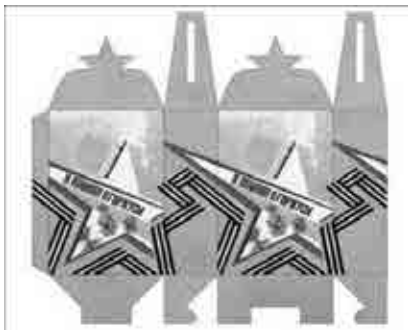
Рисунок 1. Итоговый вариант дизайна подарочной коробки

нии упаковки - современный, оригинальный дизайн, эргономичность и практичность упаковки. Сформулированы требования к предмету проектирования. Проведен анализ аналогов косметической продукции. Разработаны поисковые варианты, в результате их анализа, выбрано окончательное решение дизайнера комплекта упаковок, доработаны выбранные варианты. Дизайн подарочного набора косметической продукции включает следующий перечень полиграфической продукции: подарочная коробка; развертка упаковки туалетного мыла; развертка упаковки зубной пасты; развертка упаковки крема для лица; развертка упаковки крема для ног; развертка упаковки шампуня; развертка упаковки крема после бритья. Для выполнения работы использовались следующие программные средства компьютерной графики: Corel DRAW, Adobe Photoshop. Итоговый вариант дизайна подарочной коробки (рис. 1):